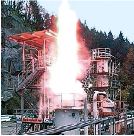
Abbildung 6: Explosionsdruckentlastung