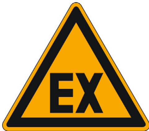
Abbildung 3: Warnung vor explosionsfähiger Atmosphäre

Im Sinne der ATEX-Benutzerrichtlinie wird die Stelle, an der explosionsfähige Atmosphäre in solchen Mengen auftreten kann, dass spezielle Maßnahmen zum Schutz der Sicherheit und Gesundheit der betroffenen Arbeitnehmer erforderlich sind, als Gefahrenbereich und die entsprechende Atmosphäre an diesem Ort als gefährliche explosionsfähige Atmosphäre bezeichnet.