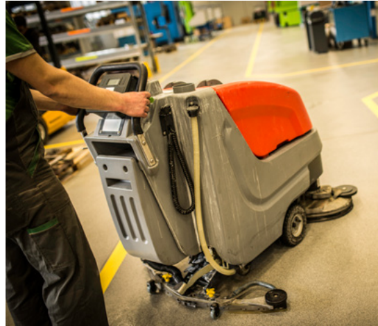
Abbildung 5: Ungeeignetes Verfahren (links) und geeignetes Verfahren (rechts) zur Beseitigung von brennbarem Staub

Der brennbare Staub sollte immer vorrangig direkt an der Entstehungsstelle abgesaugt werden. Ein Sauberhalten des Arbeitsplatzes ist ebenfalls sehr wichtig. Die Ansammlung von brennbarem Staub kann durch regelmäßige Reinigungsmaßnahmen mit geeigneten Reinigungsgeräten verhindert werden. Das Aufwirbeln von brennbarem Staub muss vermieden werden, da es eine Staubwolke erzeugen könnte. Das Befeuchten des brennbaren Staubs vor dem Entfernen verhindert Aufwirbeln.