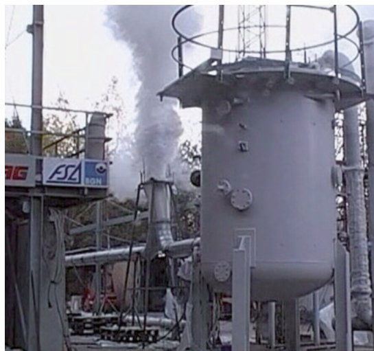
Abbildung 8: Explosionstechnische Entkopplung mit Entlastungsschlot