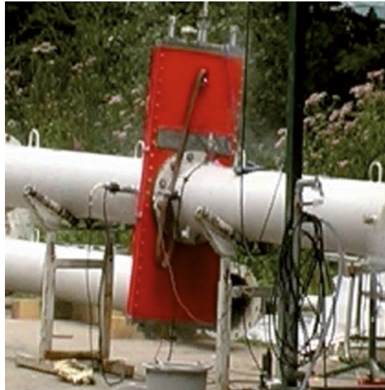
Abbildung 7: Explosionstechnische Entkopplung mit Schnellschlussschieber