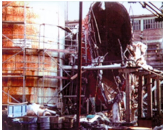
Abbildung 1: Ergebnis einer Explosion

Sehr gefährlich sind auch die während der Explosion entstehenden schädlichen Reaktionsprodukte, und der Verbrauch des zum Atmen benötigten Sauerstoffs aus der Umgebungsluft, der zur Erstickungsgefahr für die Arbeitnehmer führen kann.