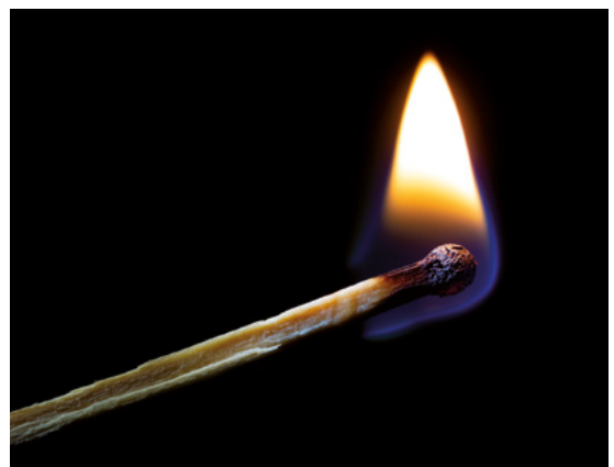
Abbildung 2: Zündquellen