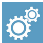
Maschinen- und Systemsicherheit