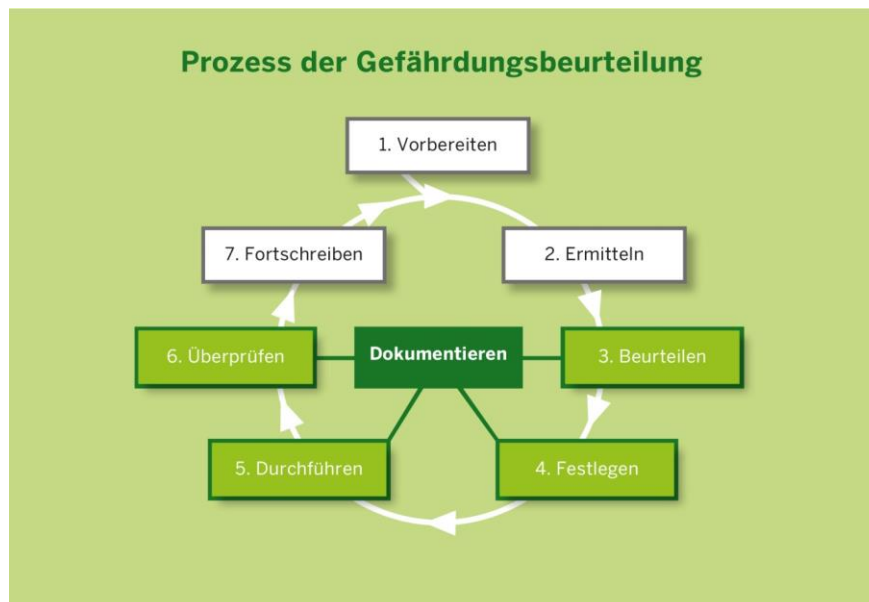
Abb. 1: Prozess der Gefährdungsbeurteilung