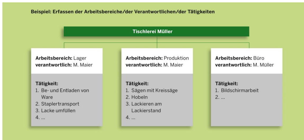
Abb. 3: Beispiel: Erfassen der Arbeitsbereiche/der Verantwortlichen/der Tätigkeiten